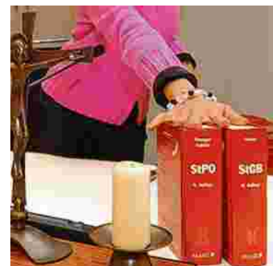
Strafprozess am Landesgericht in Eisenstadt.

Beide Angeklagten entschuldigten sich vor Gericht und gaben an, aufgrund von finanziellen Problemen Schleppungen durchgeführt zu haben. Sie nahmen die noch nicht rechtskräftigen Urteile an. Die Staatsanwaltschaft gab keine Erklärung ab.