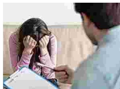
Jeder zweite Jugendliche leidet an depressiven Symptomen.