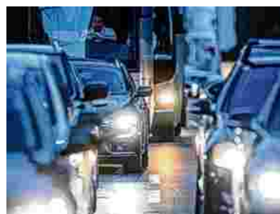
Ferienende, Konzert und Flugshow als Garant für lange Staus.