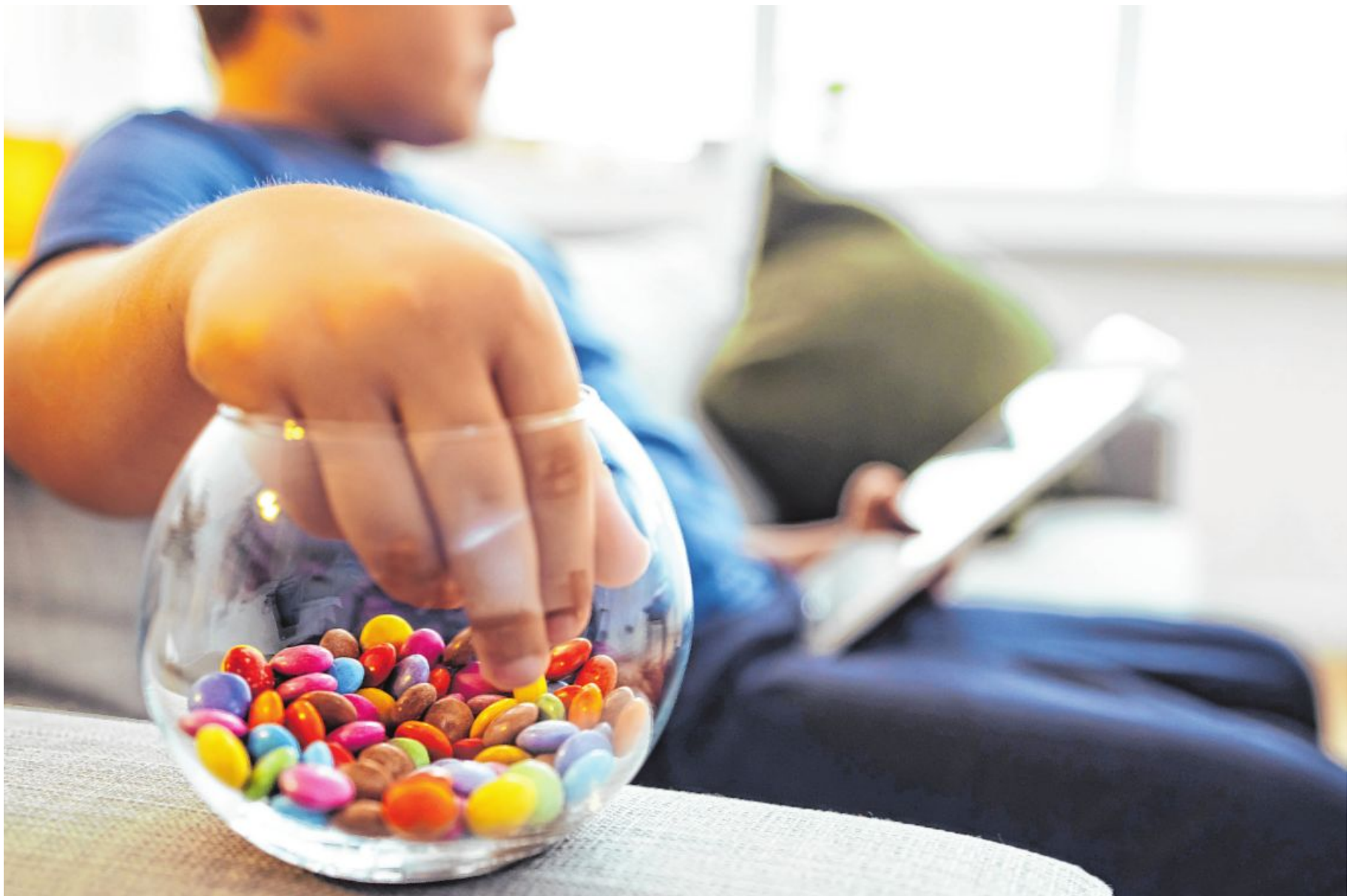
Zu wenig Bewegung und viel Süßes: Beides forciert die Gewichtszunahme von jungen Menschen, die im Erwachsenenalter unter den gesundheitlichen Folgen leiden.